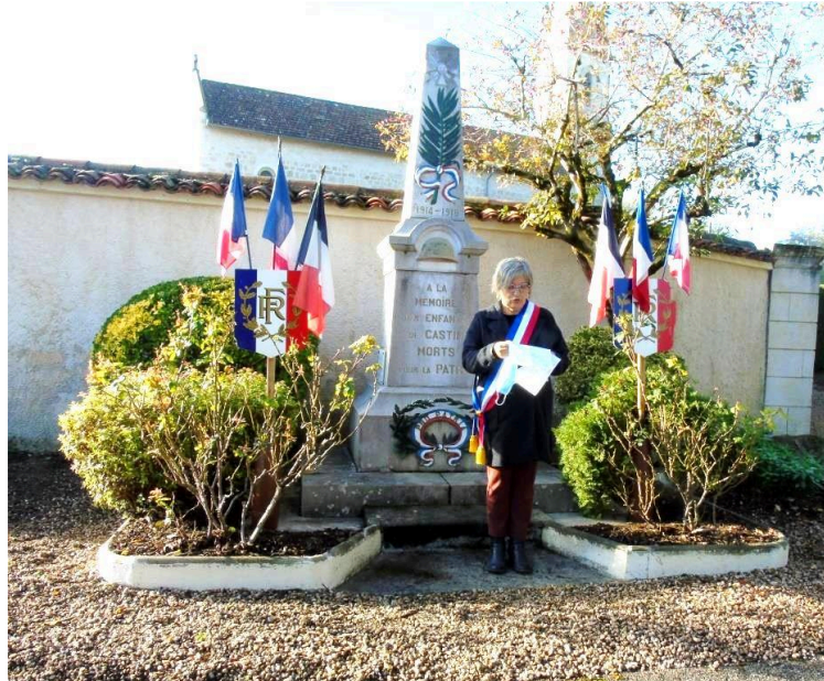
Commemoration du 11 novembre : Auch, Castin et Duran à huis clos

Compte-tenu de l'état d'urgence sanitaire et des mesures de confinement, les cérémonies du 102e anniversaire de l'Armistice du 11 novembre 1918 ne se sont pas tenues dans le format habituel cette année. Tant à Auch qu'à Castin et Duran c'est quasiment à huis clos que fut déposée une gerbe, respecté la minute de silence, chanté la Marseillaise et lu le message de Geneviève Darrieussecq, ministre déléguée auprès de la ministre des Armées, lequel se conclut en ces termes : « Chaque 11 novembre, la Nation rend également un hommage solennel à tous les morts pour la France, ceux d'hier et ceux d'aujourd'hui. Chaque année, nous rappelons leur nom ».