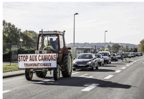
Opération escargot le 7 novembre 2017