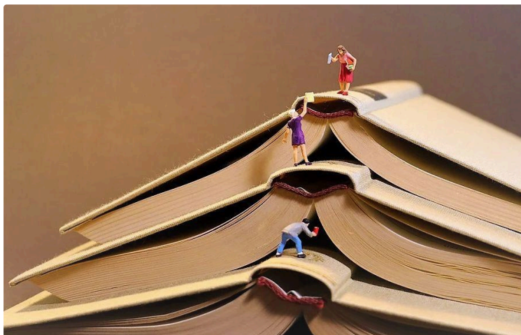
À vos marque-pages !

Chaque premier samedi du mois, le Journal du Gers vous propose une balade chez les libraires et vous révèle leurs coups de cœur du moment.