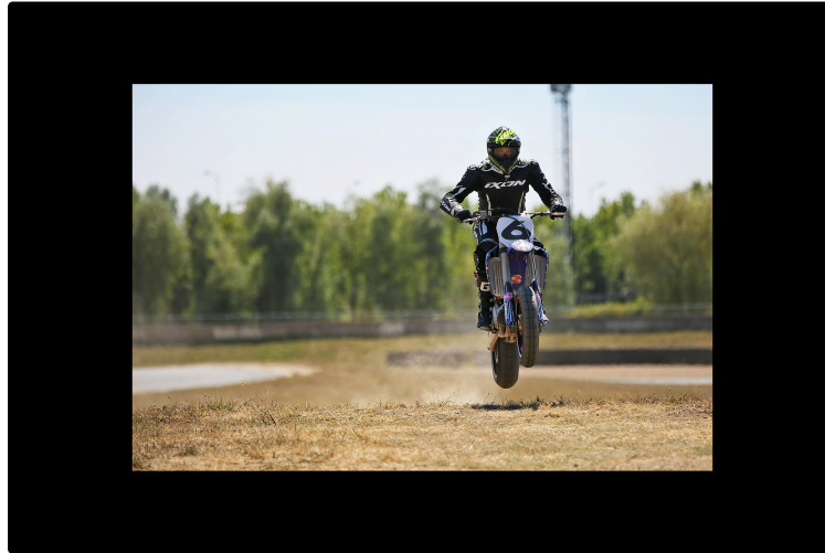
Championnat de France Superbike du 23 au 25.10 à Nogaro