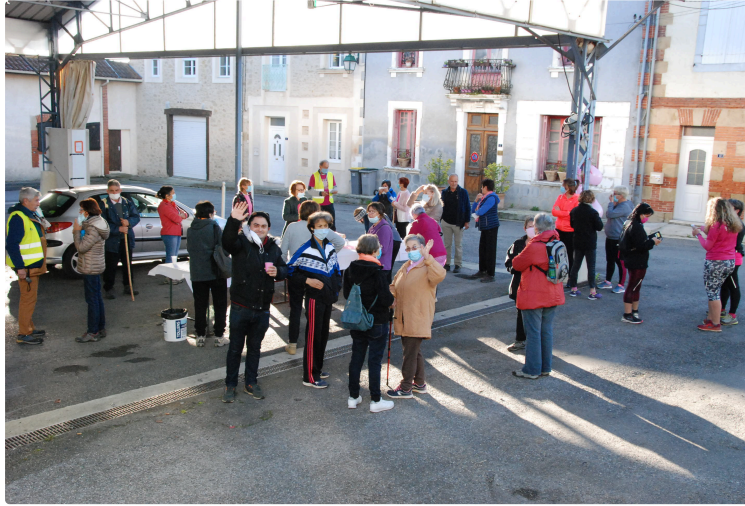
Randonnée du 18 octobre 2020

Comme chaque année, le mois d'octobre est une période de sensibilisation à la prévention et la prise en charge du cancer du sein, chapeauté par la Ligue contre le Cancer.