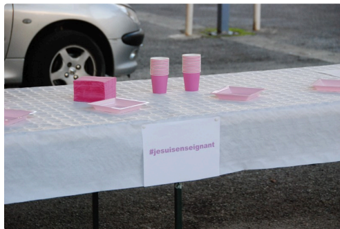
En mémoire de Samuel Paty.