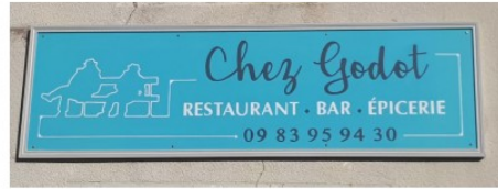
"Chez Godot" à Belmont, un restaurant mais pas seulement...