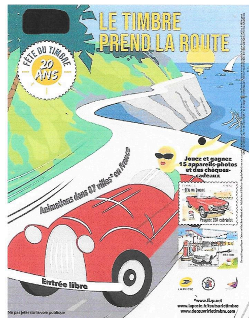
Fette octobre 2020.jpg

L'exposition sera ouverte samedi 10 octobre de 9h30 à 17h30 ; dimanche 11 octobre de 9h30 à 12h30 et de 14h à 17h. L'entrée est gratuite.