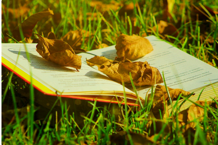
À vos marque-pages !

Chaque premier samedi du mois, le Journal du Gers vous propose une balade chez les libraires et vous révèle leurs coups de cœur du moment.