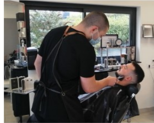
Un Barber Shop chez Mimi Design' Hair !