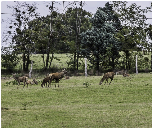
Cerf et biches