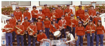
Fleurance Los Pagaïos