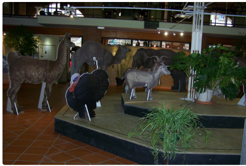
expo musée de L'isle Jourdain les Sonnaillies 009.JPG