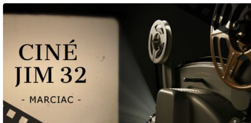
Ciné JIM 32

Programme du 29 septembre au 13 octobre 2020