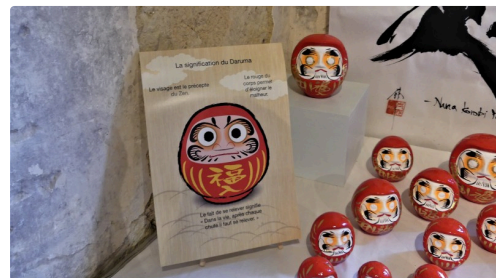
Avez-vous acheté votre daruma porte bonheur ?