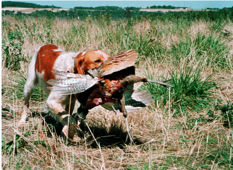
Chasse : ouverture dimanche... mais manif avant !

Dimanche 13 septembre aura lieu l'ouverture générale de la chasse. Mais les chasseurs feront entendre leur ras-le-bol samedi à Prades.