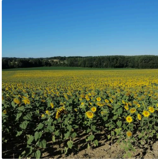
La balade de la semaine: randonnée à Courrensan

Aujourd'hui, nous quittons Vic pour une randonnée à Courrensan , petit village à 13 km de Vic.