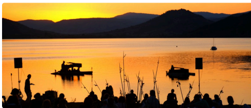
2 DR site Piano du lac.jpg

N.B. - Les photos proviennent du site ( www.pianodulac.fr ).