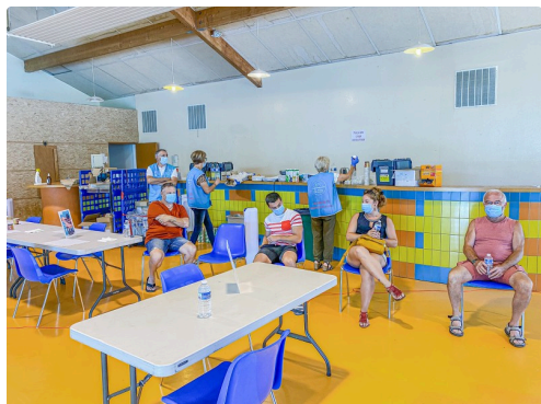
Les donateurs attendent leur tour assis ; les membres de DSNA sont en bleu