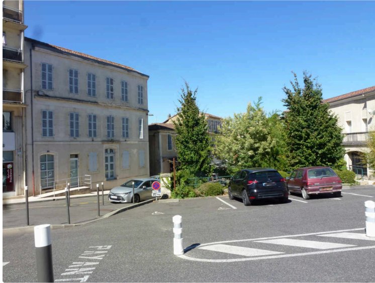
Un immeuble auscitain mis en vente par l'État