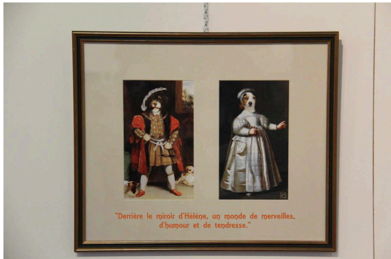
"Derrière le miroir d'Hélène, un monde de merveilles, d'humour et de tendresse."