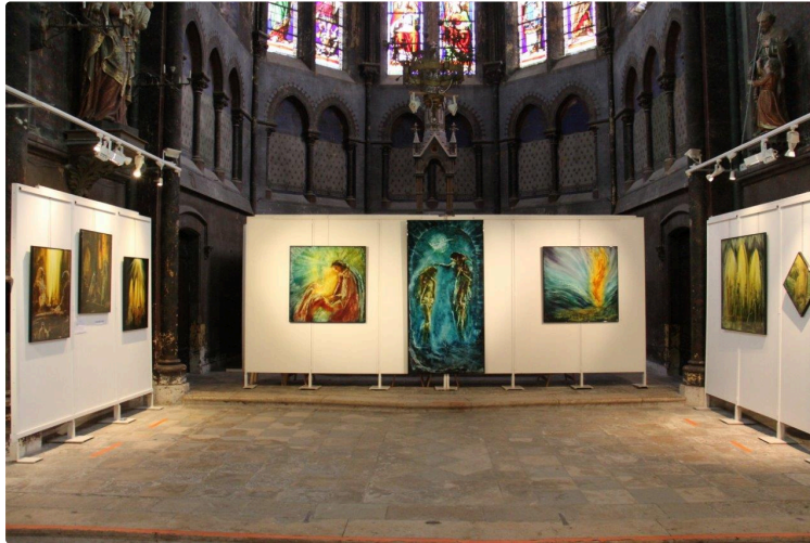
Sept artistes s'installent pour trois semaines à l'Espace Saint-Michel