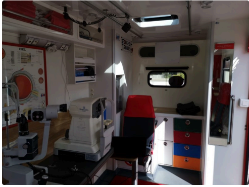
Tout est conçu comme un vrai magasin ambulant