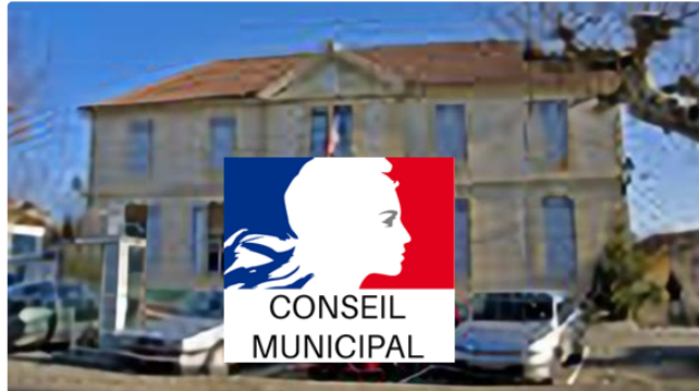
Pavie: Conseil municipal avant les vacances