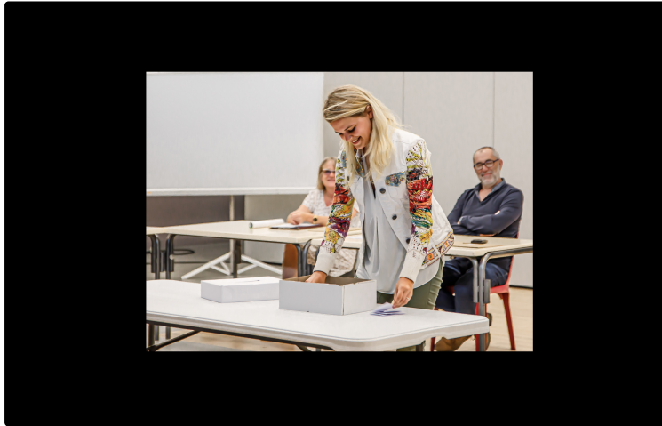
Élection des grands électeurs de sénateurs à Nogaro

Une opération rapidement menée (pour 5 titulaires et 3 suppléants)