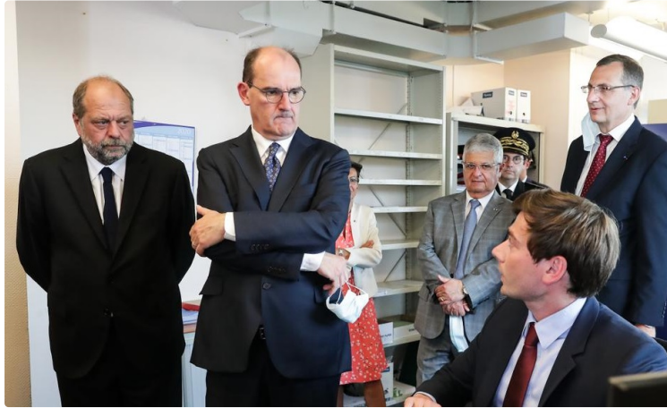
Jean Castex, mission impossible

Au-delà de l'opération de communication politique, l'équation pour le nouvel hôte de Matignon paraît insoluble. Et vouloir prioriser la réforme des retraites fait craindre un manque de discernement des enjeux.