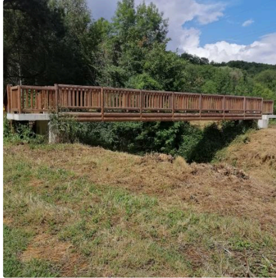
La balade de la semaine : le sentier pédagogique de la forêt domaniale Vic-Roquebrune (PR3)

Cette semaine, nous ne partons pas très loin de Vic puisque Cathy et Élodie nous font découvrir un sentier pédagogique récemment créé, le PR3 de la forêt domaniale Vic-Roquebrune .