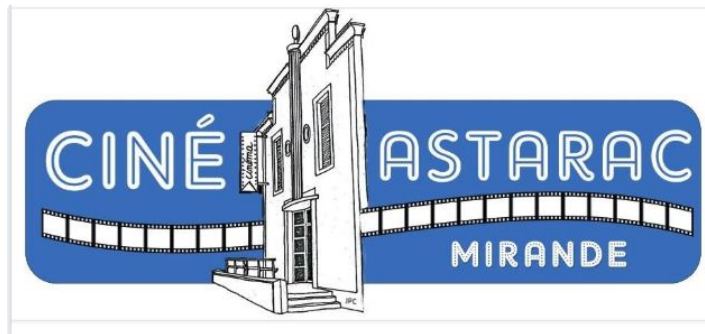
Le cinéma est de retour