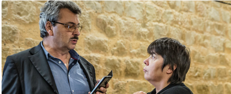
L'Office de tourisme Armagnac-Adour demande à être classé

C'est un engagement envers la CCAA, les professionnels du tourisme et les clients