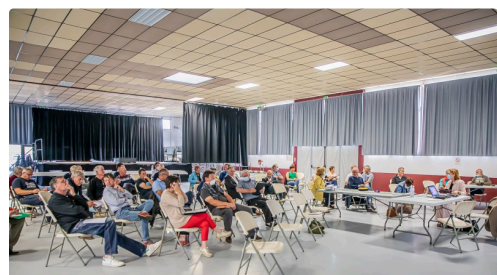
2 Le conseil CCAA dans la halle à Riscle 1bis 150620.jpg

Néanmoins, certains regrettent que, au minimum, le site Internet de l'ancien OT d'Aignan n'existe plus : on n'a plus le calendrier des divers événements et manifestations.