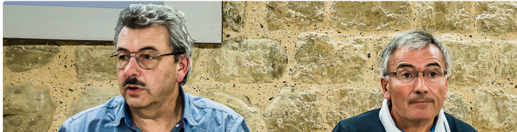
La majorité du conseil de la CCAA penche vers le rejet du projet de SDCI

Il est demandé aux conseils municipaux de se prononcer