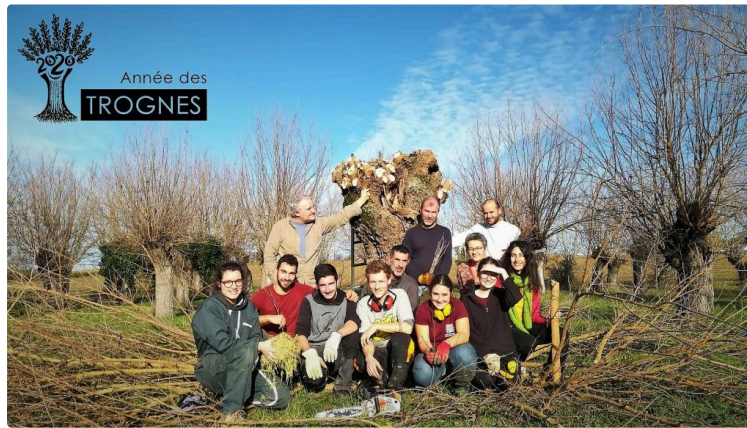
Arbre et paysage 32 inspire New-York

Son projet d'installer un espace agroforestier sur le toit d'une tour soulève l'enthousiasme