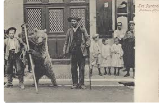
Quand l'ours était bête de foire....

Aujourd'hui, l'ours est au centre des débats animés par les bergers pyrénéens ; il est en effet un animal prédateur pour leurs élevages de brebis.