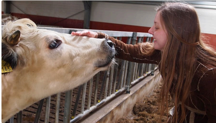
Le patois ... et les vaches

L'article que nous proposons aujourd'hui est un peu le fil conducteur entre celui qui traitait du domptage et du dressage des animaux de travail, celui relatif à l'école communale locale dans les années 1890, et le parler gascon avec toujours à l'honneur Isidore Mirel.