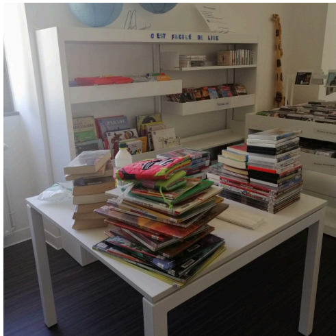
Le "stand" désinfection