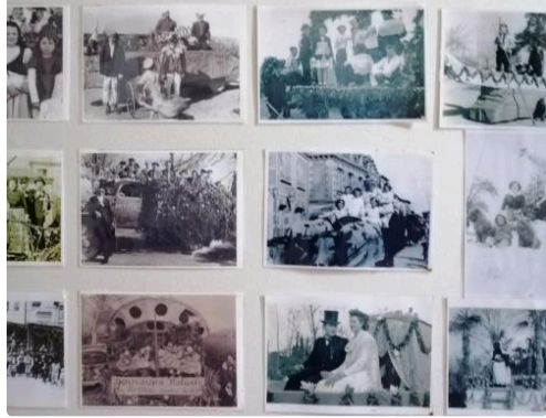
Lupiac autrefois à l'église