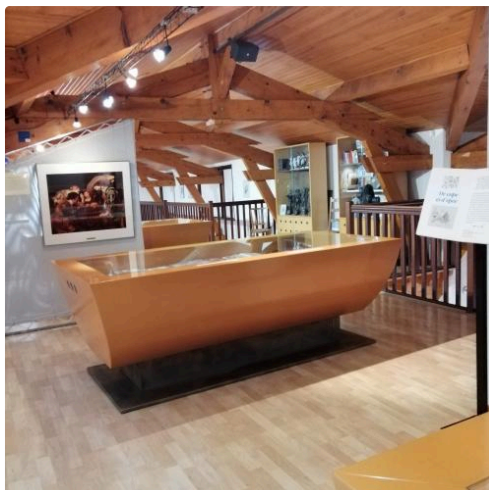
Exposition à l'étage