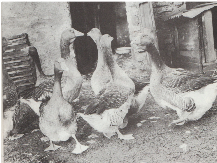
Le gavage des oies à l'ancienne

Les vacances approchent et nous ne savons pas encore comment elles se dérouleront en cette période sensible.