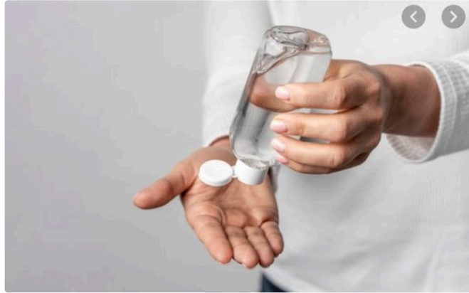
Rappel de gels hydroalcooliques

Des produits inefficaces selon la DGCCRF