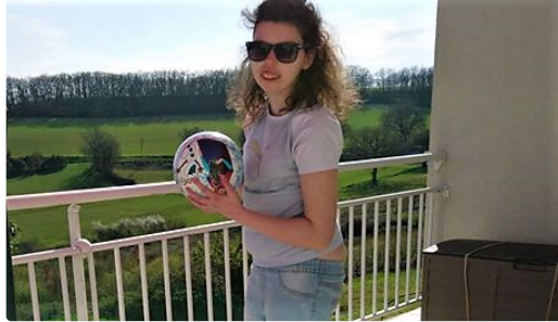
Vivre confiné avec le syndrome de Dravet

Un combat épuisant, à mener sur plusieurs fronts