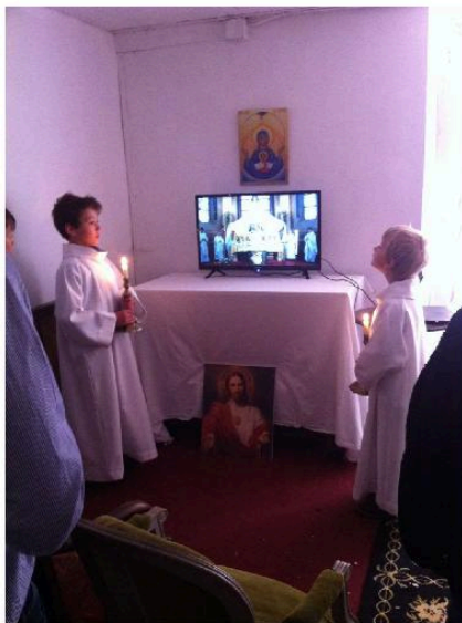
De jeunes servants de la paroisse, impatients de revenir célébrer le dimanche, ne peuvent s'empêcher de servir la messe même devant la télé !