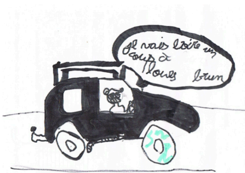
Dessin de Swan