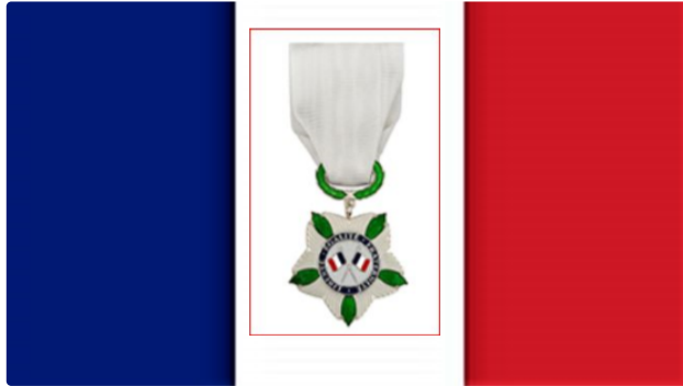
Première Journée nationale d'hommage aux victimes du terrorisme.

« Les victimes du terrorisme sont au cœur de notre fraternité nationale et de notre mémoire. Le 19 septembre 2018, le Président de la République s'était engagé à ce que soit organisée une Journée nationale d'hommage en leur mémoire » dit l'Élysée. Le 11 mars c'était la première. La date du 11 mars fait référence à l'attentat commis à la gare d'Atocha à Madrid en 2004 . Cette journée d'hommage est profondément européenne et internationale : " Unis dans l'épreuve, unis dans la mémoire ".