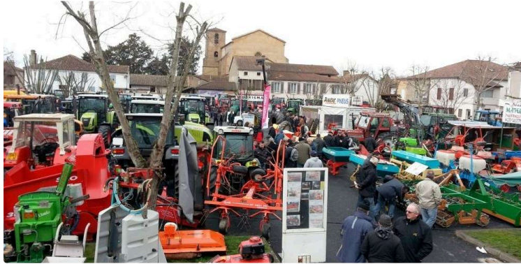
Foire de Barcelonne-du-Gers : l'occasion ou jamais

C'est ce week-end que les visiteurs sont attendus