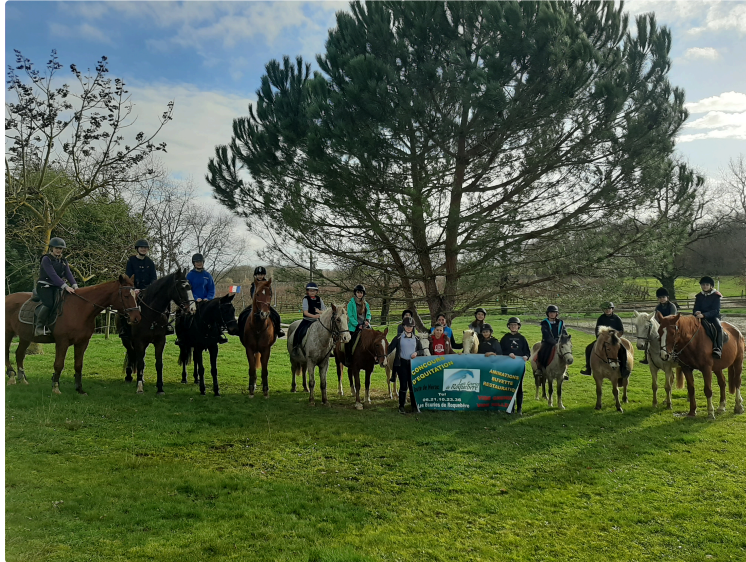
Une étape de l'Occitanie Tour Club, support du Championnat Régional

Mais en même temps une étape du Circuit Départemental, tout cela aux Écuries de Roquebère, le dimanche 9 février