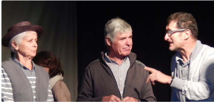
ST MARTIN Théâtre