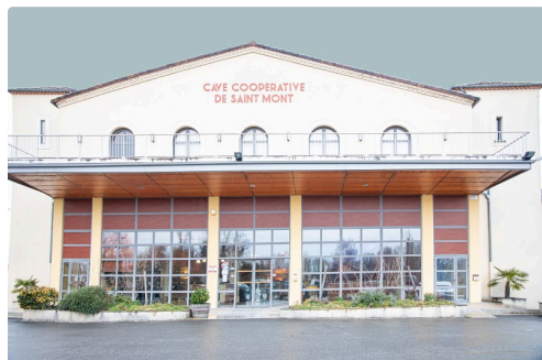
Bâtiment avec boutique, salle de dégustation, salle d'exposition et salle de réunion

(1) Créée par Anto Alquier et son épouse, précédemment liée au collège de Riscle et dissoute en 2018. (2) Modeste, l'intéressé estime que son aventure n'est pas personnelle, mais celle de toute une équipe. (3) ( https://lejournaldugers.fr/article/40045-la-cave-de-nogaro-critique-les-incoherences-reglementaires-et-fete-ses-resultats ).