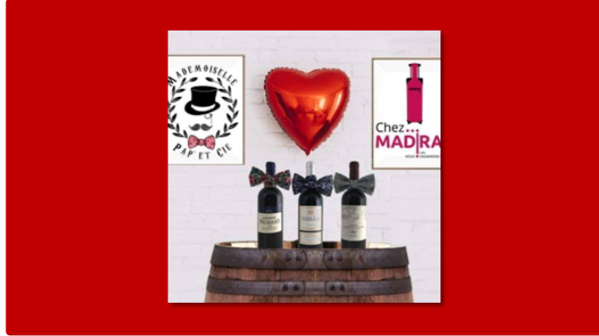
Chez Madiran & Mademoiselle pap' & Cie

Quand deux jeunes entreprises s'associent pour valoriser leur savoir-faire