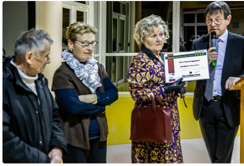
L'équipe de fleurissement reçoit un diplôme d'encouragement