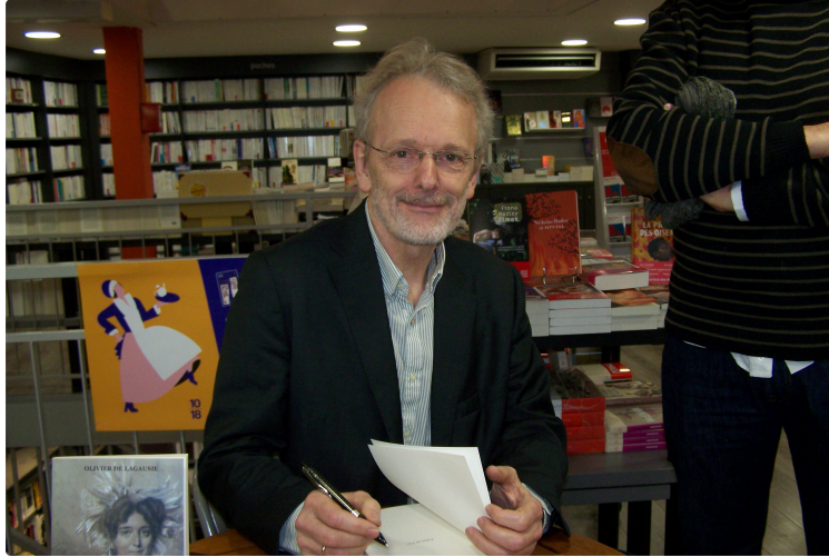
Un écrivain gimontois dédicace son dernier livre