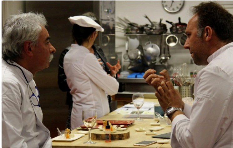
La restauration, un secteur qui recrute

De nombreux établissements sont en quête de personnel