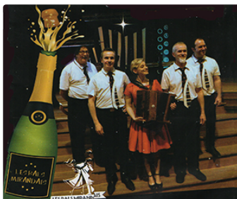
Un grand réveillon avec les Bals mirandais