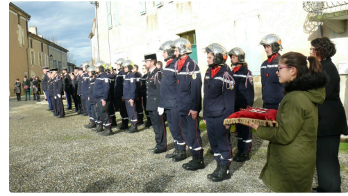
Une partie des pompiers qui assistaient à la cérémonie.